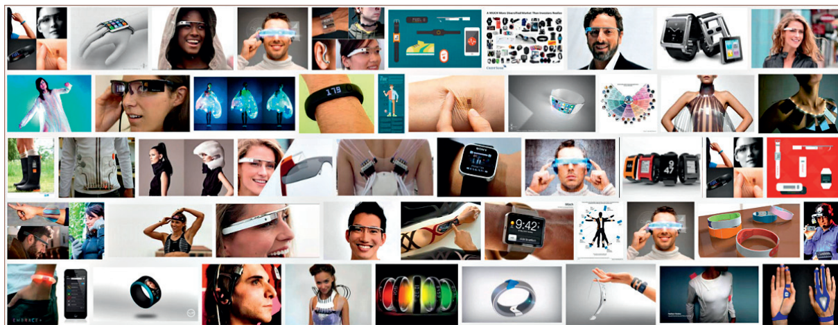
图1 新型智能设备示例

新型智能设备可以以多样的形态为用户所使用，其交互需求也存在多样性。由于智能穿戴设备的屏幕尺寸较小，且配备传感器的种类和数量相对较少，基于触屏的文本输入方式对于此类设备来说存在效率低和体验差等缺点。对于无屏设备，传统的触屏交互更是无能为力。因此，传统的基于触摸